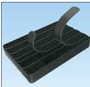
Praktisk pakke (100 stk.) HLB2S-C0