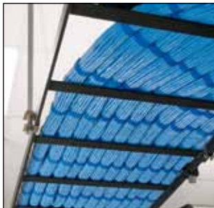
Anvendelse under tak Kontinuerlige ruller HLS-15R6