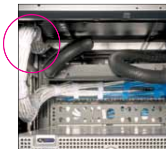
Borrelåsstrips festet i kabinett UGCTC3S-X10