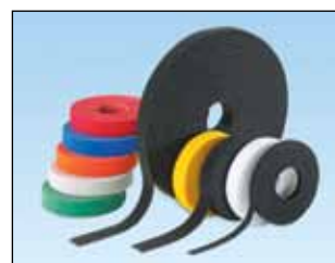
Tak-Ty®-ruller Lengder: 4,6 og 22,9 m kan kuttes til hvilken som helst lengde