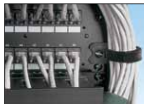
Anvendelse i rack X-Out for linseskruer nr. 10 Borrelåsteip: HLT2I-X0