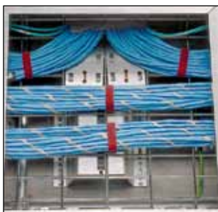
Under gulvet (bruk i ventilasjonsrom) HLSP3S-X12 HLTP3I-X12