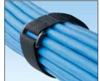
Borrelåsstrips på bunt UCT3S-X0