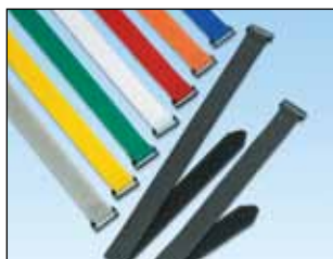
Ultra-Cinch™-bånd Strammering gir ekstra styrke