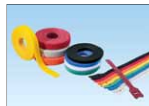
Finnes i åtte farger