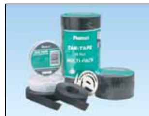
Tak-Tape™-ruller Generell festeanordning