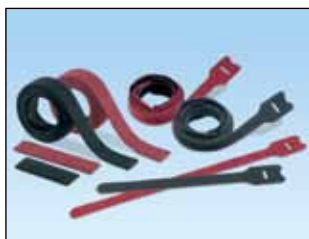
Tak-Ty® borrelås på rull – plenumgodkjente UL-klassifisert løkke- og stripsutforming