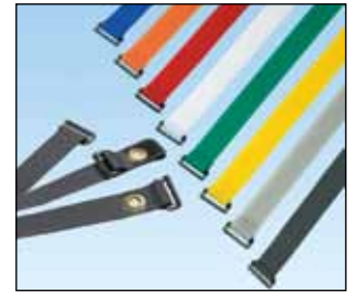
Finnes i tre utforminger med åtte farger