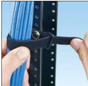
Borrelåsstrips festet på rack UGCTC3S-X0