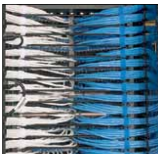
Anvendelse i rack Kontinuerlige ruller HLS-15R10, HLS-15R6