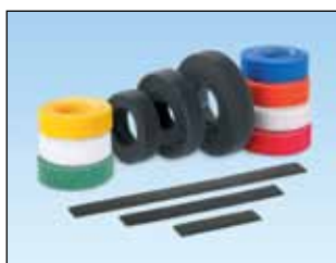
Tak-Ty® stripsbånd Ruller perforert i praktiske strips på 152, 203 eller 305 mm