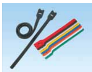
Tak-Ty® borrelåsteip Spor som muliggjør forhåndsbunting